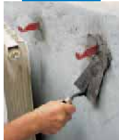
Posa di zanche per caloriferi con Lampocem