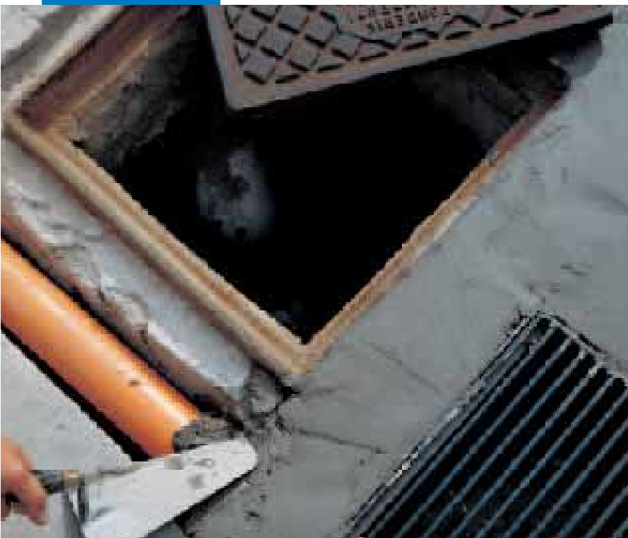
Posa di tubazioni e chiusini stradali con Lampocem