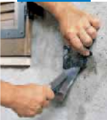
Posa di zanche per finestre con Lampocem