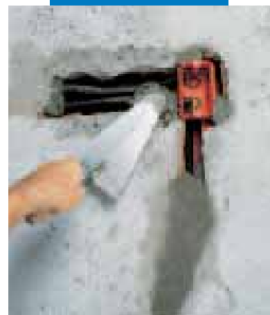
Fissaggio di scatole e tubazioni elettriche con Lampocem