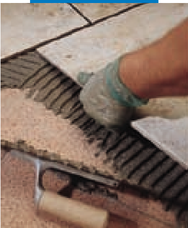
Sovrapposizione di un rivestimento in monocottura su marmette esistenti