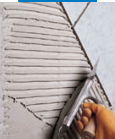
Posa di monocottura su parete in blocchi di cemento cellulare espanso