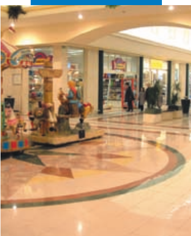
Esempio di posa di gres porcellanato - Centro Commerciale Zanchetta - Treviso