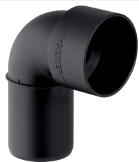
Figura di esempio