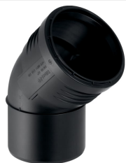
Figura di esempio