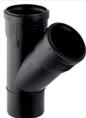
Figura di esempio