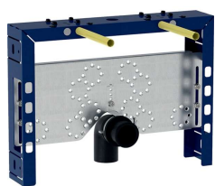
Figura di esempio