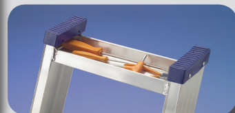
Vaschetta portattrezzi più larga cm 31x7x3

Piattaforma in alluminio rinforzato (cm 25,5x35) con ampio spazio di lavoro per gambe e piedi. Dotata di gancio di sicurezza anti-apertura