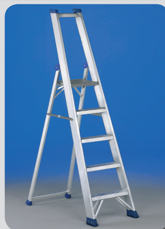
OPTIONALS Piattaforma in alluminio e barre anti apertura/chiusura