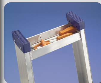
Vaschetta portattrezzi cm 26x7x3