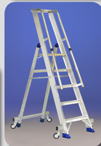
Regina Vip 4 wd