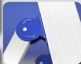
Nuova Cerniera maggiorata in acciaio verniciato