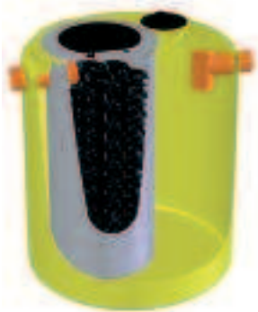
ANAPACKAGE Impianto a Filtro Percolatore

CATEGORIA PRODOTTO Impianto a Filtro Percolatore