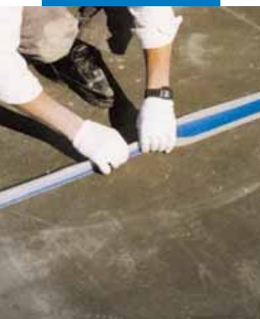
Esempio di impermeabilizzazione di un giunto strutturale in un terrazzo