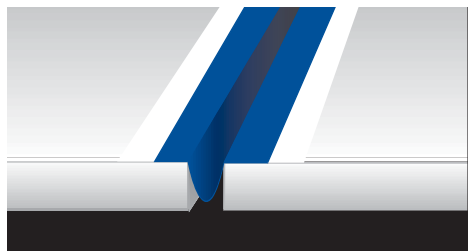
Posizionamento a omega di Mapeband all'interno del giunto di dilatazione