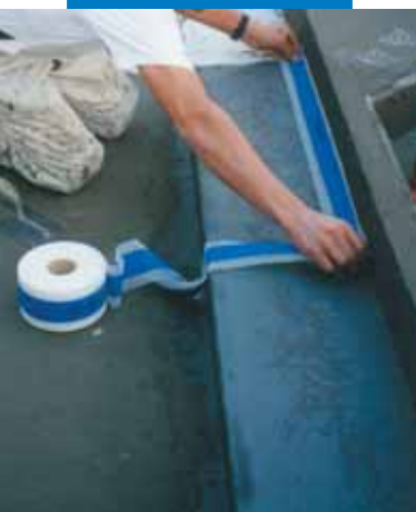
Esempio di impermeabilizzazione di Mapeband dell'angolo tra fondo e parte di una vasca