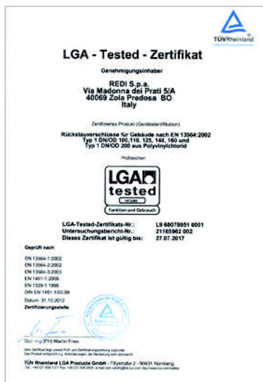
Certificato delle valvole antiriflusso "Classica" fino al DN 200

L'elenco dettagliato dei prodotti certificati è disponibile a richiesta