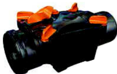
OTTIMA M/F Ø 110 mm