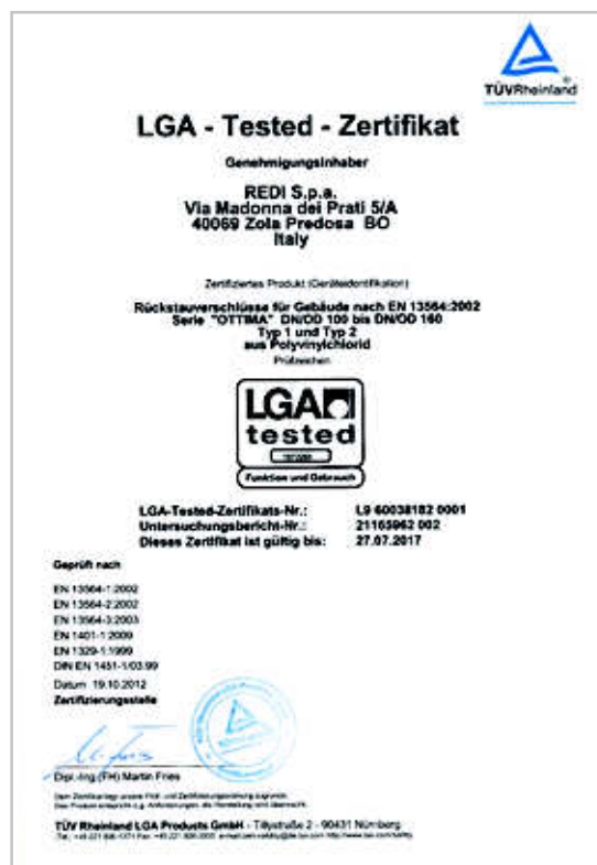
Certificati valvole antiriflusso "OTTIMA"

Le Valvole Antiriflusso REDI sono marcate CE secondo quanto stabilito nell'allegato ZA della norma europea armonizzata EN 13564-1:2002, e in ottemperanza alla Direttiva Europea 89/106/CEE del 21 dicembre/1988 sui prodotti da costruzione.